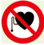
Segnaletica per soggetti con controindicazioni ai campi elettromagnetici