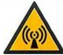
Segnaletica per pericolo per campi elettromagnetici variabili nel tempo

FIGURA 2 CARTELLONISTICA DA AFFIGGERE AD OGNI INGRESSO DEL LOCALE DOVE VIENE UTILIZZATA UN'APPARECCHIATURA A RADIOFREQUENZA, PER EVITARE L'ESPOSIZIONE DI SOGGETTI CON CONTROINDICAZIONI