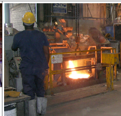
Fig3: prelievo da avanforno